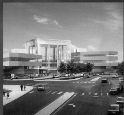
NUOVE FRONTIERE PER GLI OSPEDALI