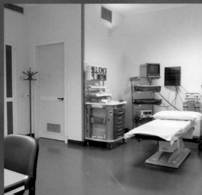
SEGNALETICA IN OSPEDALE