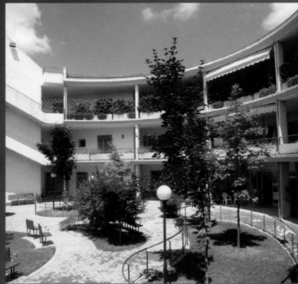
R.S.A. A VILLORBA

EDIFICI E TECNOLOGIE PER LA CURA, L'ASSISTENZA E LA RIABILITAZIONE